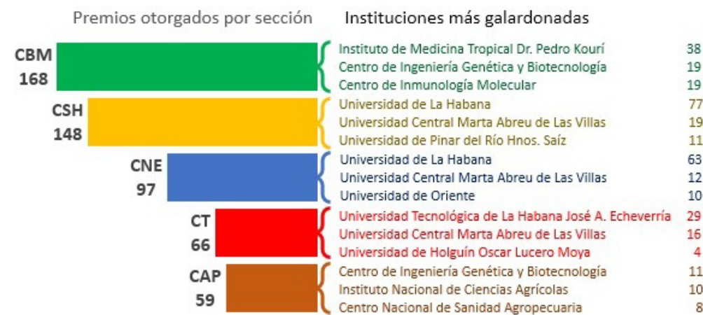
Fig. 3. Instituciones más galardonadas como entidades ejecutoras principales por cada sección académica durante el periodo 2018-2023. Algunas de estas instituciones también recibieron premios en otras secciones, que contribuyen al total general consignado

El análisis crítico de los premios evidencia que las instituciones científicas deben incrementar las investigaciones relacionadas con sectores estratégicos como la producción y el procesamiento de alimentos, la energía y las ciencias técnicas, además de aumentar la colaboración científica internacional y el nivel de introducción de los resultados premiados. Se necesita motivar más las investigaciones en las ciencias básicas, aumentar el número de patentes y publicaciones e incluir estudiantes de pregrado en las propuestas que se presentan a los premios nacionales. Si analizamos la proporción de autores premiados del 2023 (718), en relación a la cantidad de investigadores categorizados (8343), el porcentaje es de 8,61 %.