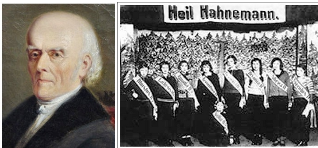
Fig. 1. (Izq.) Samuel Hahnemann. (Der.) Grupo de simpatizantes en una reunión en Chemnitz, Sajonia, en la década de los años 30 del siglo pasado (ref. [21]). En 1953 Chemnitz tomó el nombre de Karl-Marx-Stadt, pero lo recuperó en 1990.

Entre los países que alguna vez han adoptado la homeopatía como política oficial se encuentra la Alemania de Adolfo Hitler (figura 1). Entre 1936 y 1939 los nazis trataron infructuosamente de demostrar la eficacia de los tratamientos homeopáticos, llegando a organizar un congreso mundial en Berlín en 1937. El ministro Rudolf Hess, nombrado por Hitler en 1939 tercero en la sucesión política del partido nazi, fue un asiduo observador en ese congreso. 20