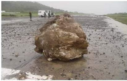
C- Huracanolito depositado sobre la pista del aeropuerto de Baracoa.