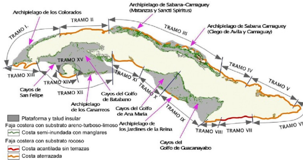
Figura 1. Tramos de costas de Cuba resaltando las costas rocosas con terrazas (línea naranja), donde es común encontrar huracanolitos (Adaptado de Iturralde-Vinent, 2013).

areno-arcilloso, 2. Costas de substrato rocoso calcáreo aterrazadas y 3. Costas de substrato rocoso acantiladas. En todos estos tipos de costas hay sectores con mangares y playas arenosas, más o menos extensos, de acuerdo a la morfología local (Fig. 1).