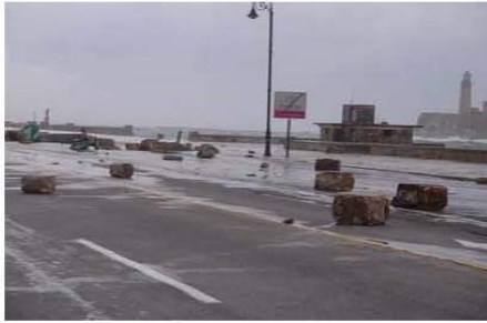
D-Huracanolitos antrópicos representados por fragmentos del muro arrancados por las olas del malecón habanero.