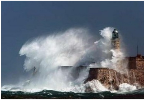
Figura 4. Típico oleaje de spray que baña la zona costera y el aire lleva las partículas de agua salada y sal tierra adentro. No tiene la fuerza destructiva de las masas de agua acarreadas por el mar de leva, las surgencias o los tsunamis.

Muy importante es distinguir las masas de agua acompañadas de oleaje, de las olas de spray. Estas últimas solamente penetran tierra adentro como finas partículas con el viento, sin provocar muchos daños mecánicos en la costa; no obstante, el salitre incrementa la corrosión de los metales y altera la pintura de las fachadas).