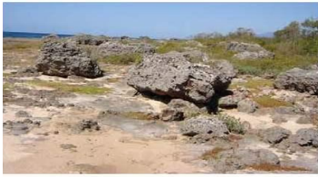
A- Campo de huracanolitos (y posibles tsunamolitos) sobre la costa a 2 metros de altura y hasta 50 metros tierra adentro, Peñas Altas, Santiago de Cuba.