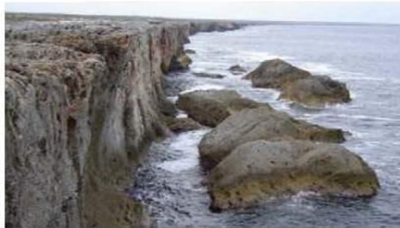
F-Bloques desplomados desde el frente de la terraza elevada, mediante el proceso que ilustra la imagen izquierda. Guanahacabibes.