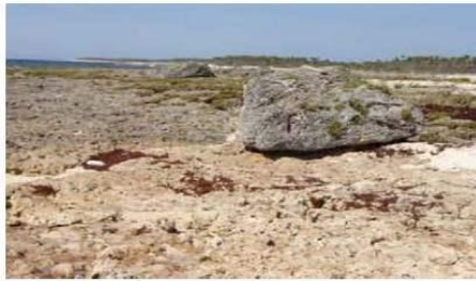
B-Huracanolito sobre el terreno situado a 5-6 metros de altura y más de 50 metros de la costa sur de Guanahacabibes.