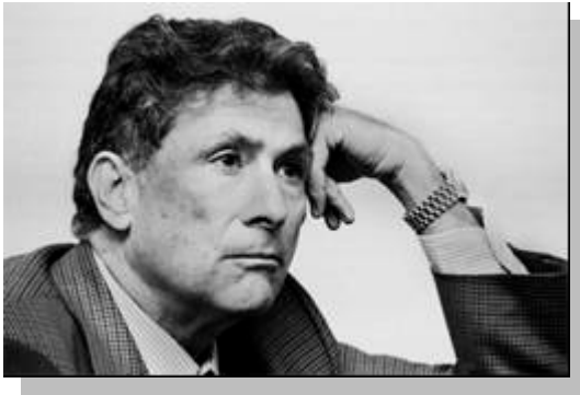
Edward Saïd (1935 — 2003)

En China puede ser que un joven que se graduó de un programa de pregrado muy débil en los Estados Unidos tenga una ventaja sobre otro joven que se graduó de la Universidad Tsinghua.