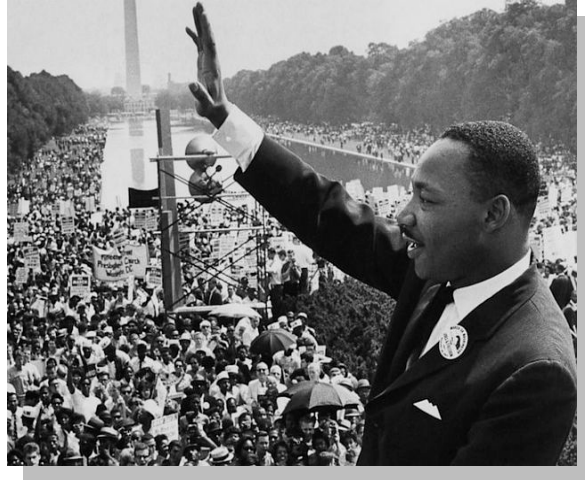
Rev. Dr. Martin Luther King

Estas opiniones eran y son bien controvertidas en los Estados Unidos.