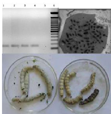
Figura 1. Se observan larvas de gusano de seda sin síntomas y con síntomas de Grasseria (placa Petri de izquierda a derecha), detección por PCR y visualización de partículas virales por microscopía electrónica